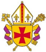
Tapio Luoma Arkkipiispa